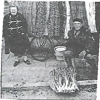
Gdy kryzys ogarnie USA, nędza w Polsce pogorszy się jeszcze bardziej

ponownego rozwoju gdzie indziej na świecie wystarczyły by kapitał zaczął tam przysypywać. Np. ostatnio pieniądź wpłynął do Japonii doprowadzając do wzrostu wartości Jena (zagrożając tym samym zniszczeniem uzdrowienia japońskiej gospodarki) i zmniejszenia wartości dolara.