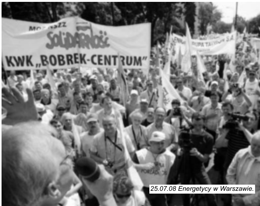
25.07.08 Energetycy w Warszawie.

chać się takim głosem i zdać sobie sprawę z własnej siły, z siły zorganizowanych pracowników.