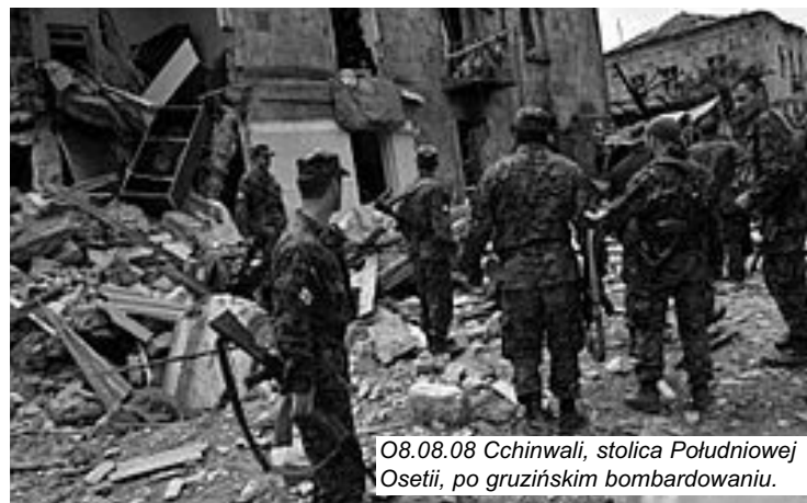
08.08.08 Chinwali, stolica Południowej Osetii, po gruzińskim bombardowaniu.

Wojna gruzińsko-rosyjska powinna nas wzmocnić w opozycji wobec „tarczy”, okupacji Iraku i Afganistanu oraz ewentualnego ataku na Iran (patrz Inicjatywa „Stop wojnie” na s. 12).