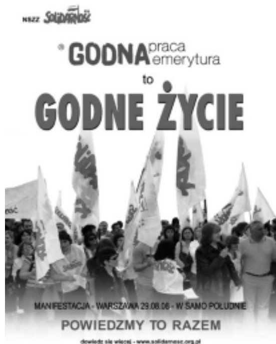
Demonstracja, Plac Piłsudskiego, pt. 29.08 g. 12.00

Str. 2-3: Filip Ilkowski, Andrzej Żebrowski,