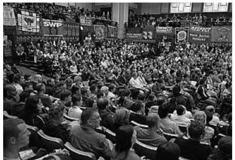
03.07.08 Londyn. Otwarcie konferencji Marxism 2008.

Pełen, znacznie obszerniejszy tekst można znaleźć na: http://www.lewica.pl/index.php?id=16792