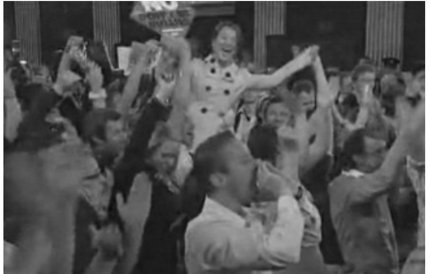
13.06.08 Dublin. Radość po ogłoszeniu wyniku referendum.

Richard Boyd Barrett Tłumaczył Eryk Baradziej