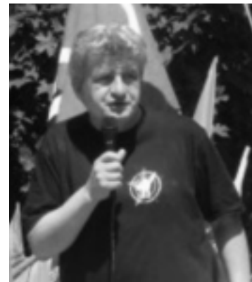
08.06.07 Hel. Piotr Ikonowicz na demonstracji Inicjatywy „Stop wojnie” przeciw Bushowi.

Wszystkie te rozważania o łączeniu niewielkich grup lewicowych niczego nie załatwią, bo istotne jest przekonanie ludu, a nie elitarne sojusze kilku garstek rewolucjonistów. Łączenie kanap nic nie da, jeżeli nie znajdziemy sposobu na rozszerzenie bazy społecznej lewicy. Wybory, droga parlamentarna to konsekwencja sukcesu lewicy, a nie jego źródło. Konieczna jest natomiast współpraca między tymi, któ-