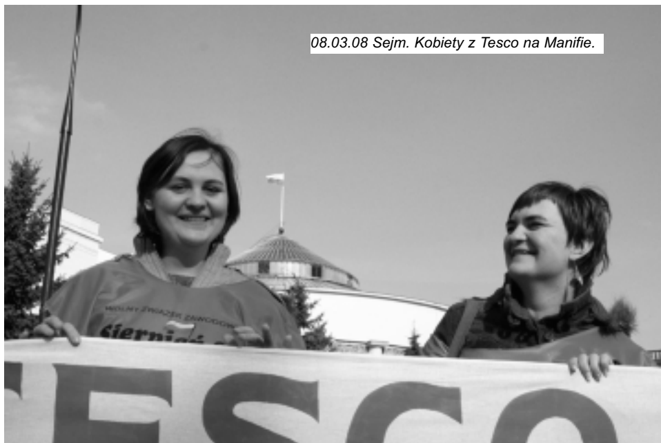
08.03.08 Sejm. Kobiety z Tesco na Manifie.

To żywotne zainteresowanie burżuazji rodziną i dyskryminacją kobiet wyjaśnia, dlaczego pełne wyzwolenie kobiet wymaga obalenia kapitalizmu poprzez jednolitą walkę klasy pracowniczej. Jedność klasy robotniczej wymaga, żeby pracownicy mężczyźni, jak również kobiety pracownice, walczyli o równość i wyzwolenie kobiet.