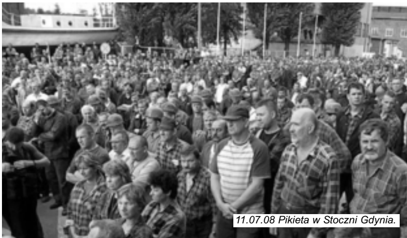
11.07.08 Pikieta w Stoczni Gdynia.