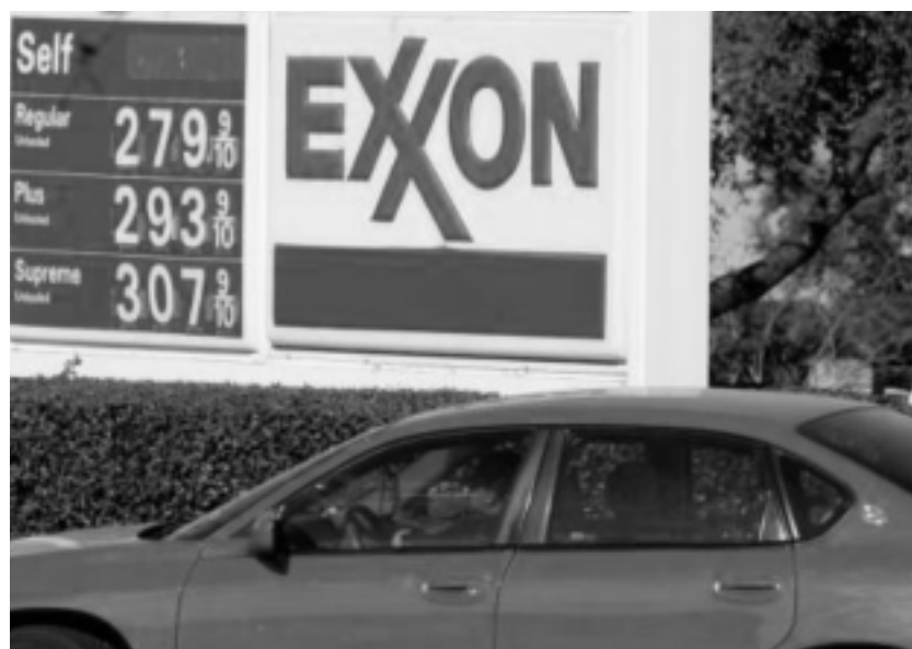
Korporacja Exxon Mobil ogłosiła rekordowe zyski wśród wszystkich amerykańskich firm – 40,6 mld dolarów (na rok 2007). W tym roku prawdopodobnie padnie kolejny rekord.