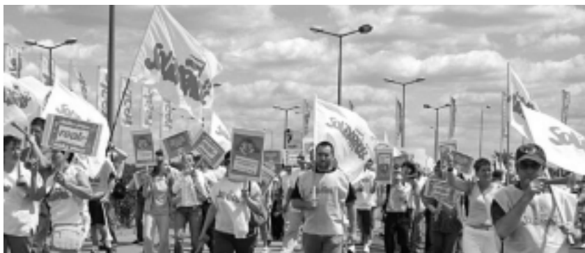
02.07.08 . Pikietą ok. 250 pracowników przed siedzibą reala w Warszawie. "Solidarność" w marketach real-Polska domaga się wzrostu płacy zasadniczej o 500 zł.

21 lipca odbył się strajk ostrzegawczy w Zakładach Mięsnych "Mazury" w Elku. Głównym postulatem protestujących było żądanie podwyżki stawki godzinowej o 3 zł dla każdego pracownika. W zorganizowanym wcześniej referendum, w którym udział wzięło 60,22 proc. załogi, aż 94 proc. opowiedziało się za strajkiem. Pracownicy nie godzą się już na pracę za minimalne wynagrodzenie. Z jednej strony rosnące koszty utrzymania z drugiej zaś coraz większe zyski przedsiębiorstw są impulsem do tego, by ci, co ten zysk wypracowują, zażądali godziwych wynagrodzeń.